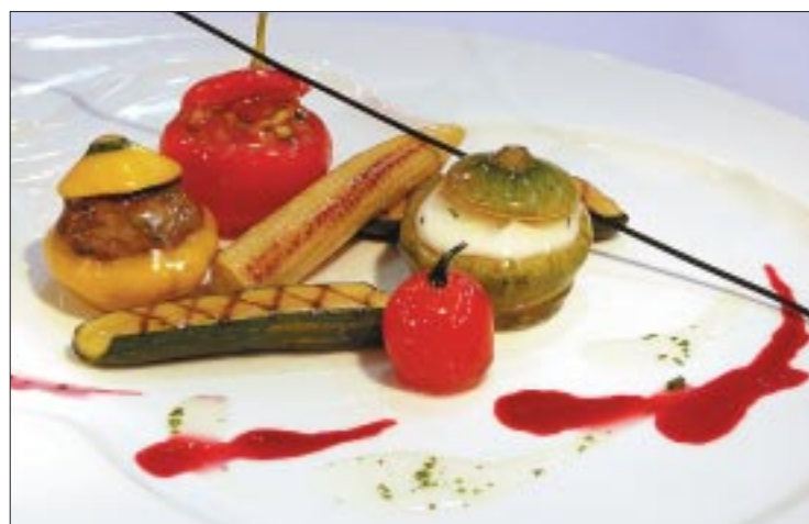
Kochnati des Grossherzogtums Luxemburg: eine vegetarische Vorspeise mit interessanten farblichen Kombinationen.