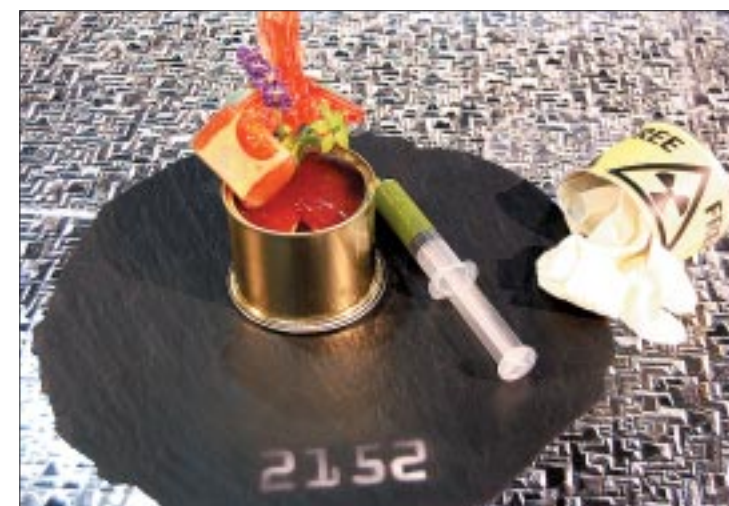
Die Walliser Rhoneköche zeigen in ihrer Schau, wie sie sich die Kochkunst der Zukunft vorstellen: Gericht in der Dose mit Saucen-Spritze.