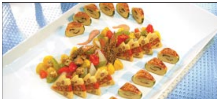
Aargauer Kochgilde: vegetarische Restaurationsplatte «Vision» mit Zucchini, Tofu, Kichererbsen-Bohnen-Terrine und gedünstetem Gemüse.

samt 19 Einzelaussteller zeigten fantasievolle Werke. Was auffällt: Es wird mit verschiedenem Geschirr experimentiert und originelle Anrichtarten sind angesagt. Ideen aus der Ausstellung.