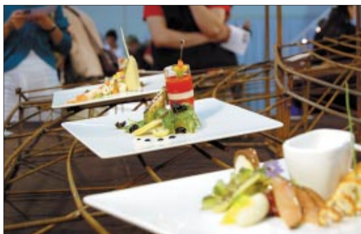
Die neue Schweizer Koch-Jugendnationalmannschaft: Impression von ihrem Ausstellungstisch, der auch in Luxemburg zu sehen sein wird.