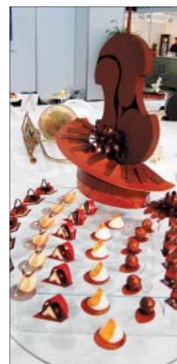
Ein schönes Gericht der Schweizer Jugendnationalmannschaft.