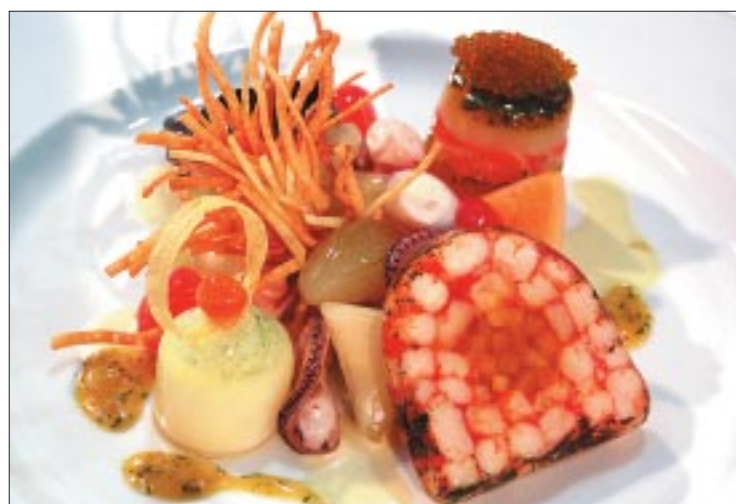
«Copains des alpes Suisse»: Kreation für die festliche Schauplatte mit Thunfisch, Jakobsmuschel-Lachsturm, Melonen, Gurken und Tintenfisch.