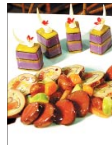
«Warm gedacht, kalt ausgestellt»: Wildgericht mit blauen Kartoffeln.