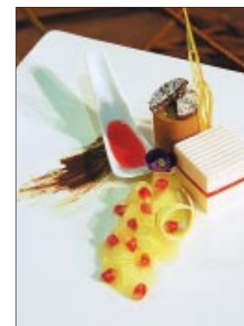
Bayerische Crème mit Glühwein, Brownie-Halbgefrorenem, Birnen.