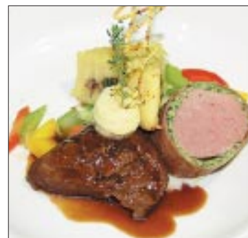
Hauptgang: Kalbsfilet im Schinken, Kalbsbäggli, Griessgnocchi.