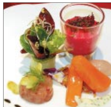
Vorspeise in der warmen Küche: Lachs auf Rösti und Randensuppe.