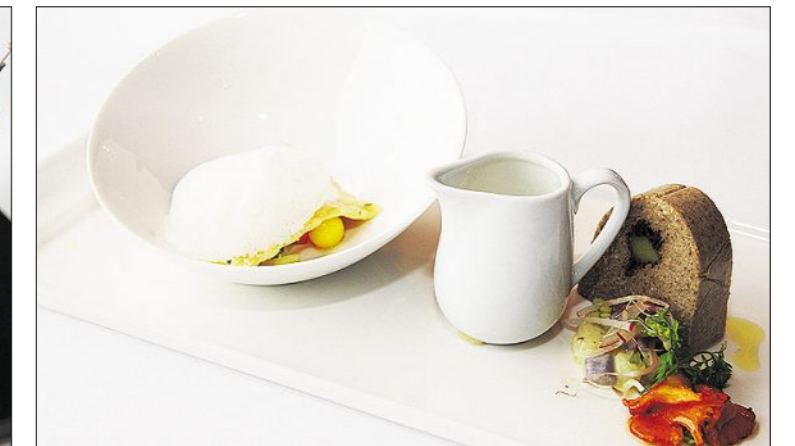
Entrée: émulsion de court-bouillon, rissolle avec farce aux herbes et terrine aux champignons sur vinaigrette de pommes de terre fumées.