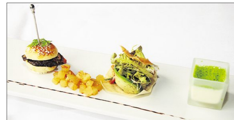
Entrée: brioche aux noix avec farce aux champignons shiitake, salade avoironnée à l'avocat, panna cotta à la truffe et mousse de persil.