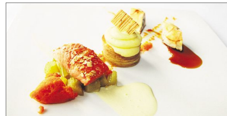
Plat principal: roulade de dorade royale grillée avec pancetta et épinards dans un manteau de manioc, filet d'omble poché avec miel au gingembre.