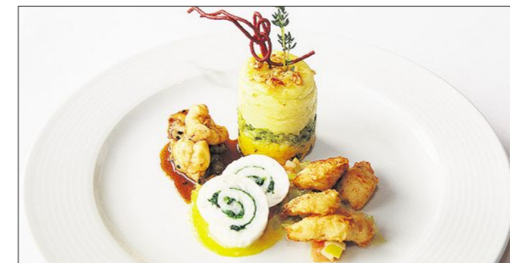
Trilogie de poissons avec boudoir et câpres, sandre façon tempura, rouleaux de limandes, tour de polenta et de pommes de terre, et poireaux.