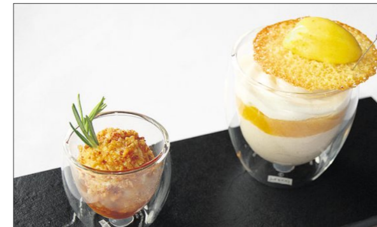
Dessert avec strudel aux abricots séchés dans un sucre au romarin, mousse aux marrons, mousse de lait à la lavande et sorbet gingembre-abricots secs.